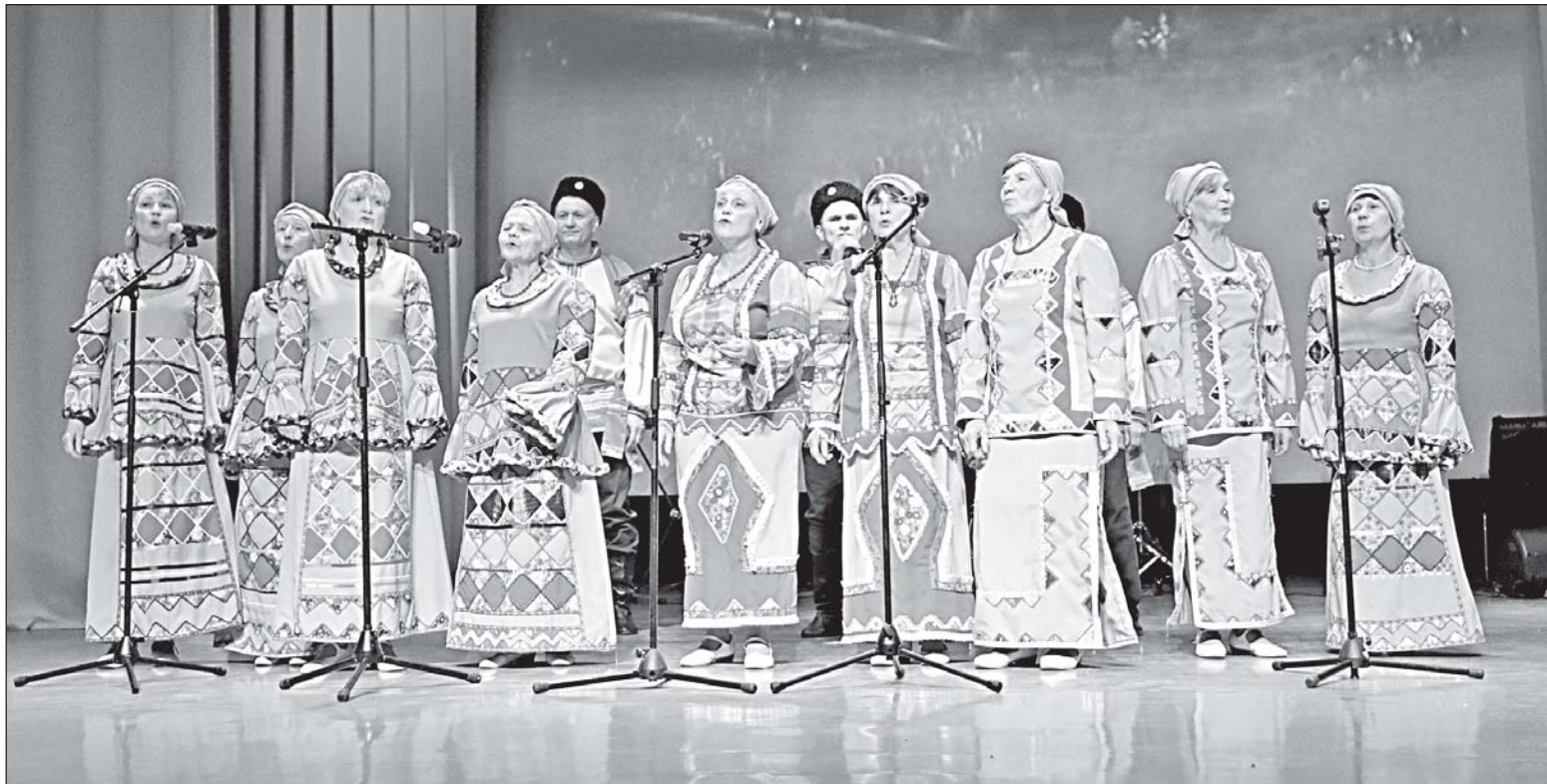
■ Вокальная группа «Дубрава».