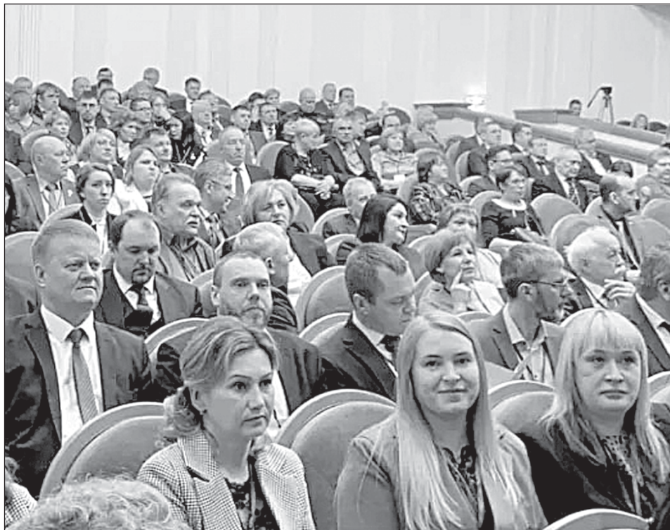
■ Делегация Кожевниковского района на пленарной части съезда.

На съезде Совета муниципальных образований по итогам прошедшего