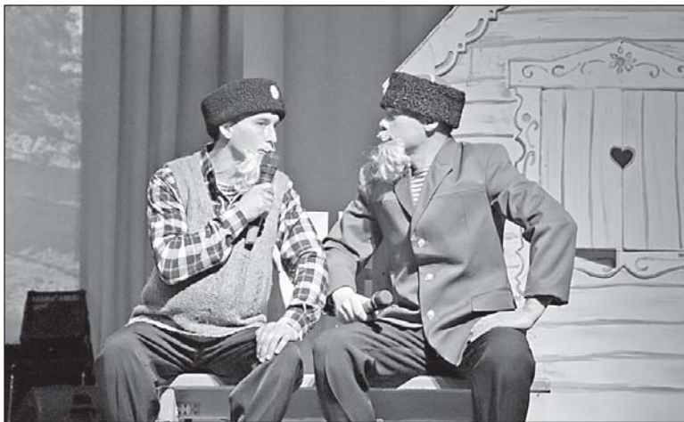
■ Главные герои сценки.

лило на этом? Выставка старинных фотографий, деревенская утварь. За каждым экспонатом – своя неповторимая история. Ярмарка, на мой взгляд, удалась. Купили торт, выпечку. В концертной программе выступила внучка, она обучается в Томском колледже культуры на хореографическом отделении, так что болела за нее. Восхитили главные герои сценки – дедушки, их мастерская игра и вживание в роли. Не было ни одной заминки, весь текст выучили на зубок. Мы им так хлопали! Все прошло на достойном уровне. Я часто хожу на концерты в городе, поэтому есть с чем сравнить. Дубровчане – лучшие!