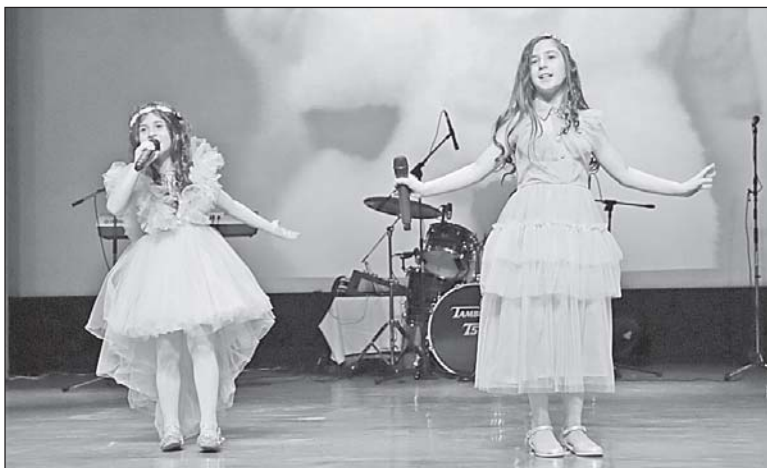
■ Сестры Кургинян.