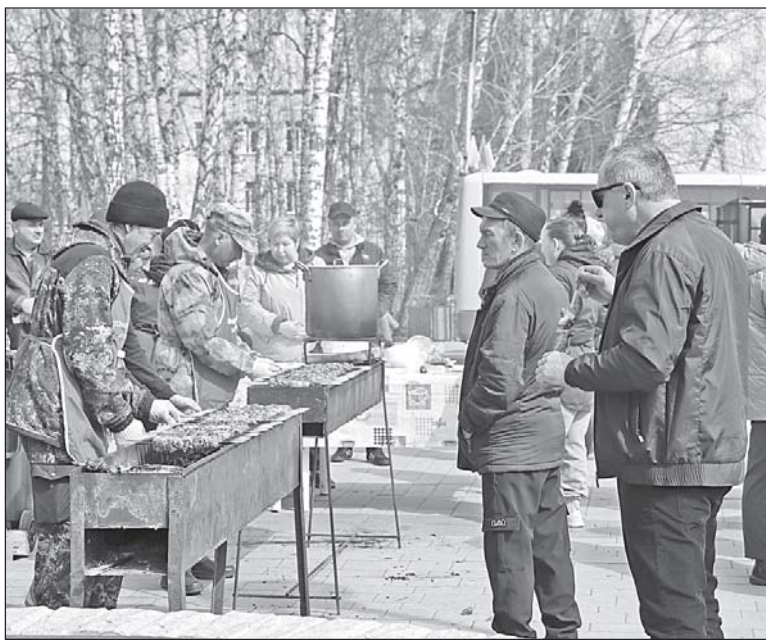
■ Шашлык и уха от АО «Дубровское».

День выступления дубровчан совпал с Вербным воскресеньем. И, конечно, без веточек ивы и подготовки к святой Пасхе на мероприятии не обошлось. Букеты вербы и соответствующая атрибутика напоминали о приближающемся празднике. Любимый мог написать пасхальную восточку солдату, смастерить и расписать яичко. Дети охотно принимали в них участие.