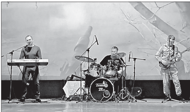
■ Группа «Центральный телеграф».