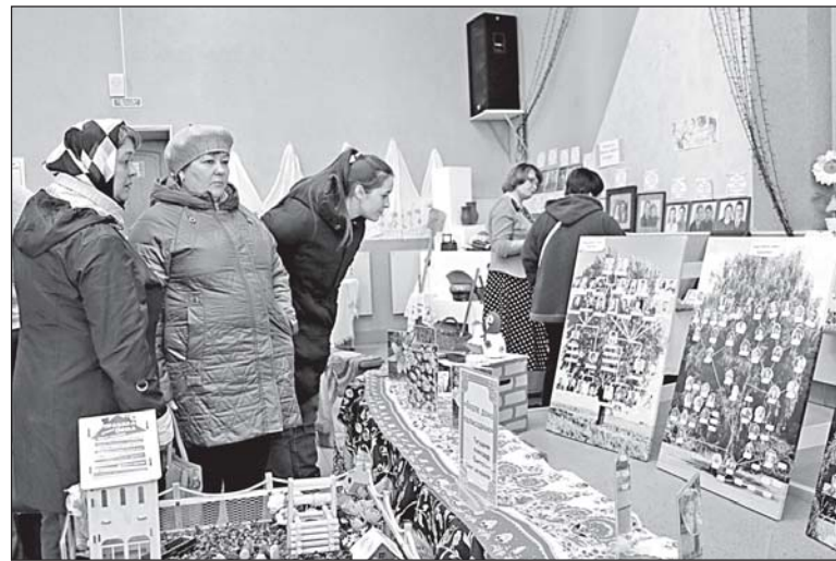
■ На выставке мастеров прикладного творчества.