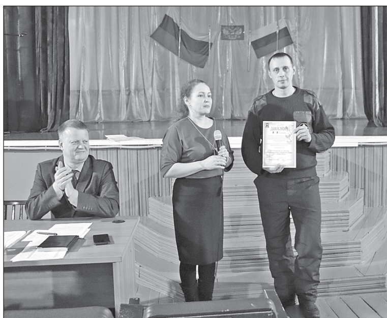
■ Награждение сотрудников Староювалинской пожарной части.

лока у населения хозяйство не может: это сложный процесс соблюдения технологий и требований.