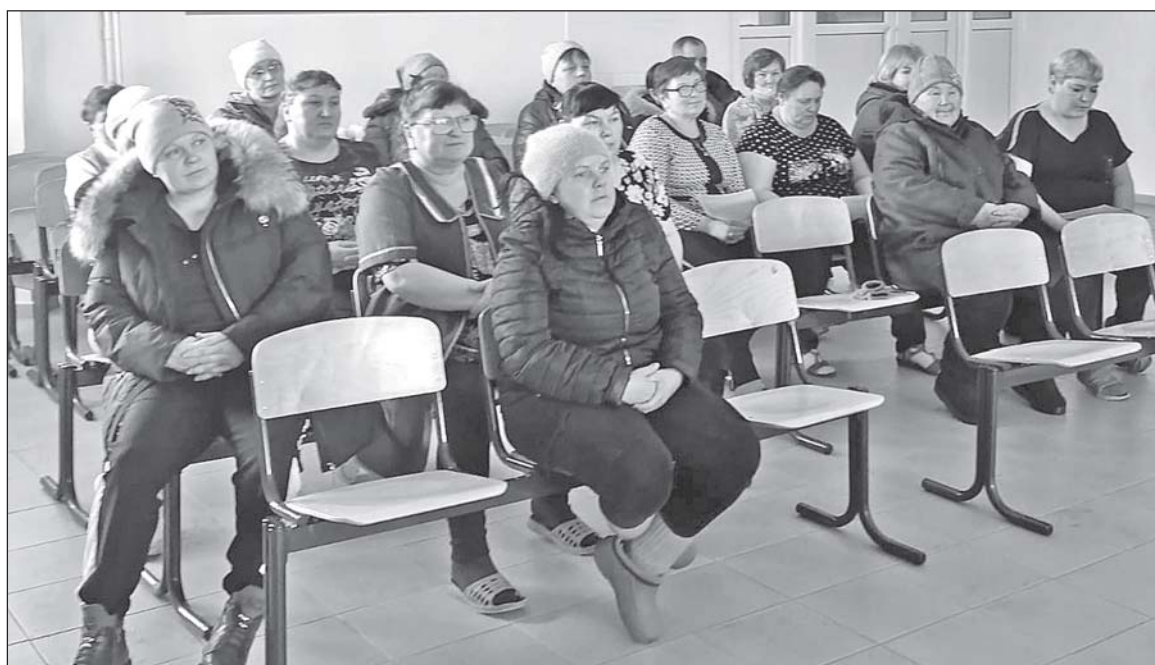
■ На встрече с жителями д. Зайцево.

В Хмелевке он побеседовал с женщинами, которые плетут маскировочные сети для отправки в зону проведения СВО.