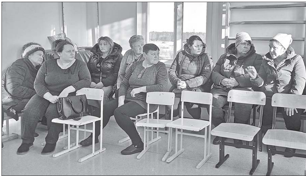
■ Беседа с апталинцами.

Основными задачами на 2024 год являются обеспечение исполнения бюджета, выполнение мероприятий по благоустройству населенных пунктов и другие. В планах - привлечь денежные средства по программе «Инициативное бюджетирование» на реализацию проектов: благоустройство территории кладбища в Старой Ювале; ремонт водопроводных сетей в Хмелевке (2 этап); обустройство контейнерных площадок в Новой Ювале; установка светодиод-