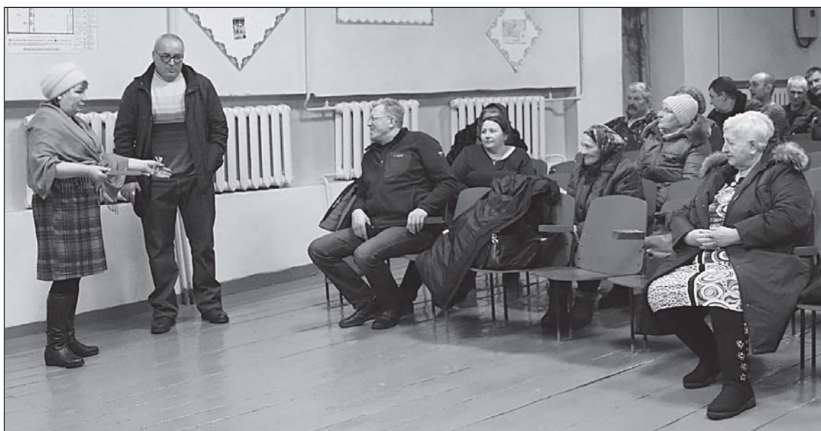
■ Решение вопросов в Елгае.