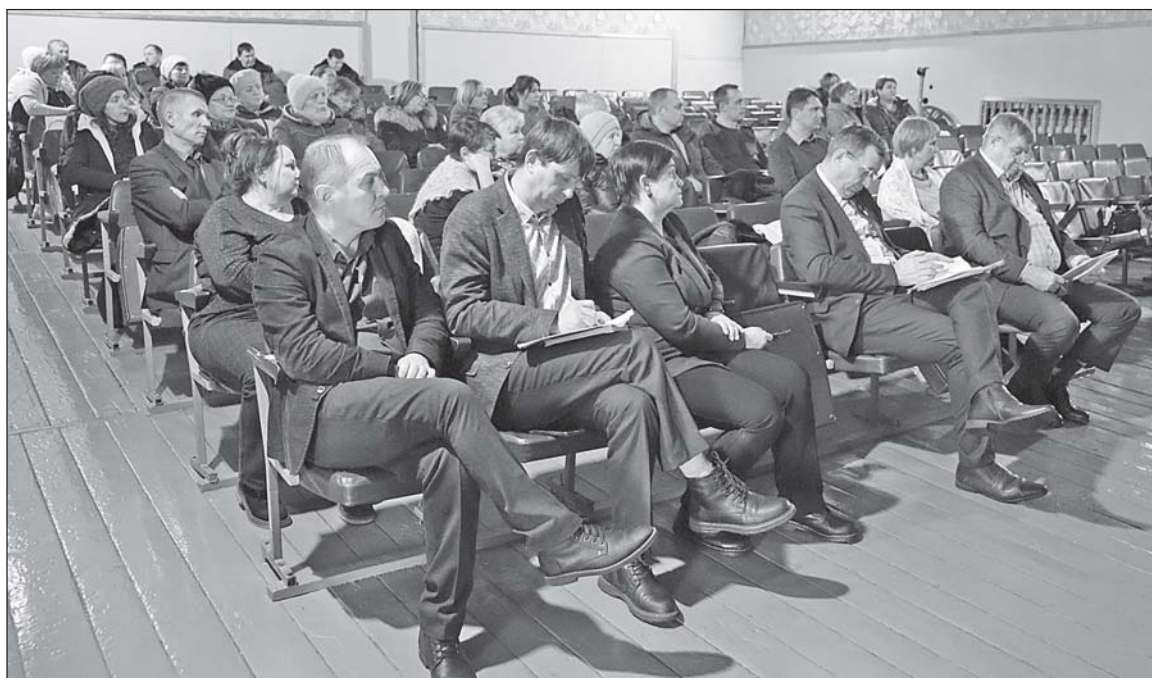
■ В Староювалинском Доме культуры.