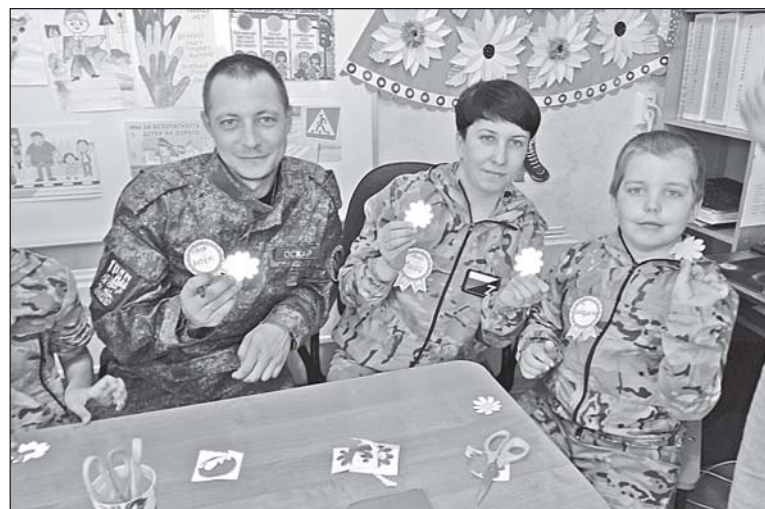
■ Ромашки для всей семьи.

На различных этапах конкурса юные инспекторы движения показывали свои знания по Правилам дорожного движения, оказанию первой помощи при ДТП, практические навыки в фигурном вождении ве-