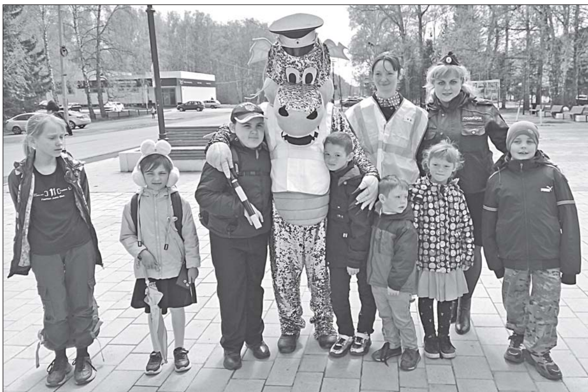
■ Безопасный маршрут.

Большую профилактическую работу, направленную на обеспечение безопасности на дорогах, проводит отделение ГИБДД отдела МВД России по нашему району