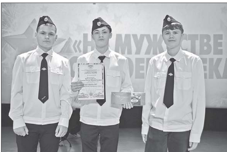
■ Мужское трио из Базоя.