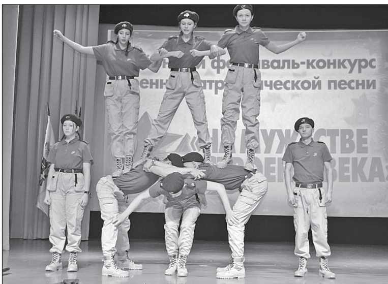
■ Отряд «Честь имею» КСОШ №1.