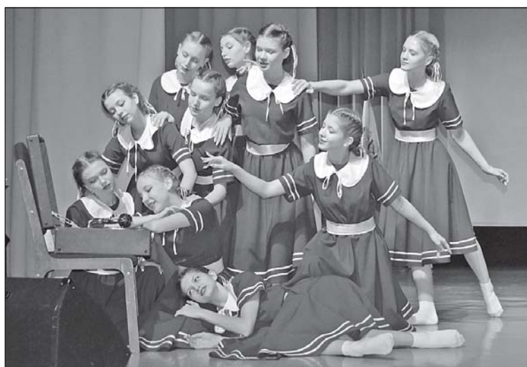
■ Вальс коллектива «Вдохновение» ЦКид.