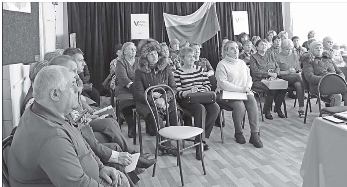
■ В Новопокровском Доме культуры.

Расходы составили 11659527 руб. На осуществление деятельности в сфере дорожного хозяйства израсходовано 3529972 руб., в том числе на очистку от снега автомобильных дорог местного значения - 860000 руб.; на устройство недостающего уличного освещения в д. Аркадьёво - 48000 руб.; на разработку проектно-сметной документации на устройство тротуаров - 180000 руб.; на ремонт автомобильной дороги в с. Десятово на ул. Тайгинской - 1516,252 руб.; на ремонт дороги в с. Новопокровка на ул. Красная Горка - 585467 руб.; на оплату строительного контроля по ремонту дорог - 69439 руб.; на работы по скашиванию травы на обочинах - 96000 руб.; на изготовление металлической конструкции для остановочного павильона и посадочной площадки на автобусной остановке в д. Сафроновка - 75000 руб. На благоустройство было израсходовано 922038 руб.: на уличное освещение и электроэнергию - 334998 руб.; техническое обслуживание сетей уличного освещения - 144000 руб. На содержание в надлежном