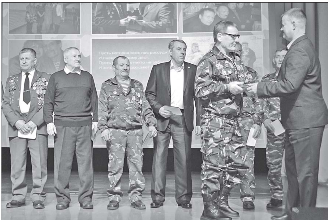
■ Вручение наград афганцам.

Благодарственное письмо от Томской региональной органи-