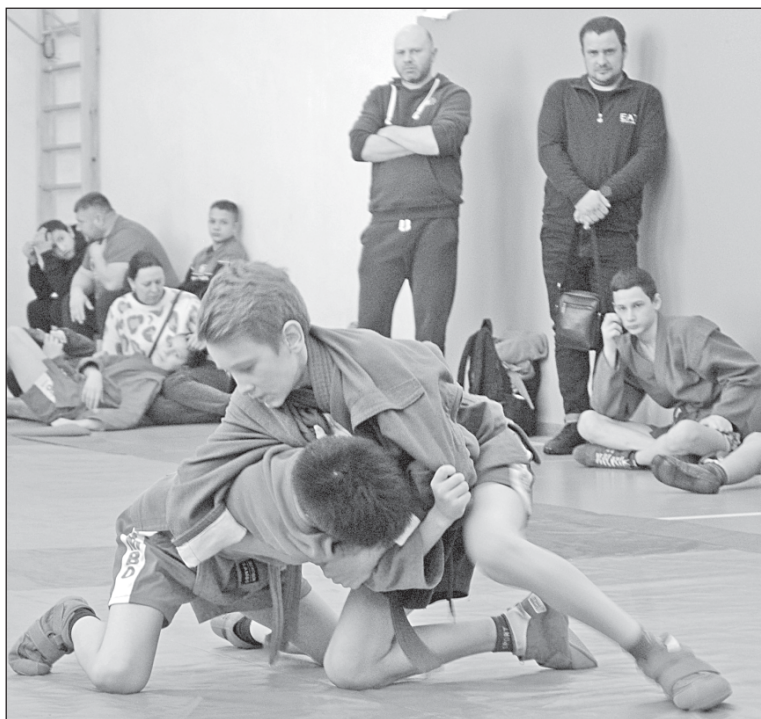
■ Жаркая схватка на ковре.