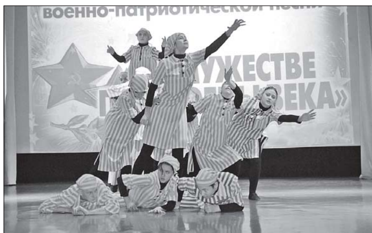
■ Композиция «Бухенвальд».